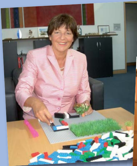
Bundesministerin Ulla Schmidt mit ihrem Baumaterial